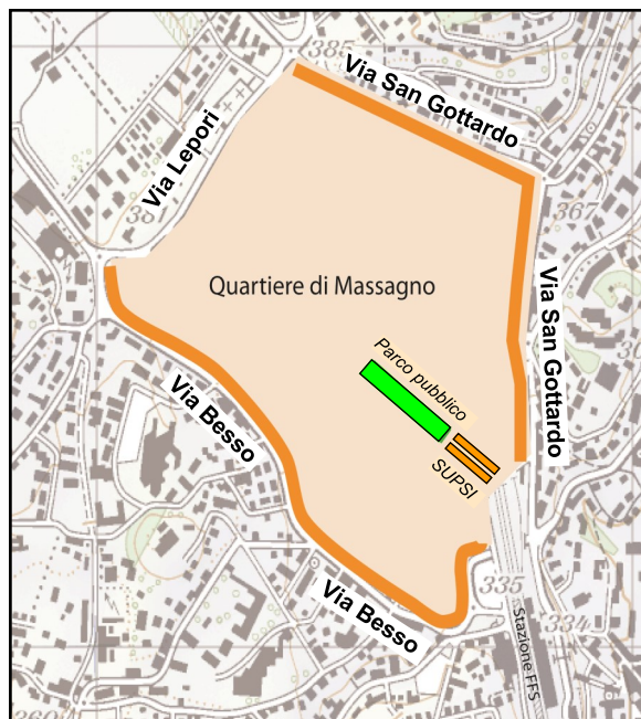
(lo schema urbanistico 2010 di Tita Carloni e altri, ora condiviso da tutti)

Ringraziamo tutte e tutti coloro che ci hanno sostenuto nella nostra azione. Ad ognuno di loro è dovuto parte del successo ottenuto.